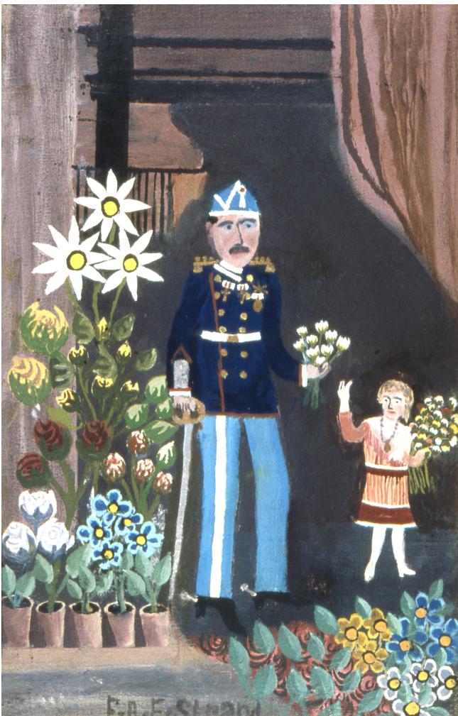
F.A.F. Strand: Kong Christian X i fuld uniform

Naivismens kunst har sjældent flere lag. Den er nem at gå til, og ofte bliver man rigtig glad af at kigge på naivistisk kunst.